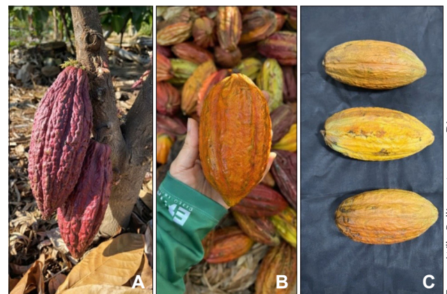
Figura 1 - Frutos de cacauero dos clones produzidos no Semiárido Mineiro

Além das características físicas, os frutos foram avaliados quanto ao teor de sólidos solúveis (SS) (°Brix). A determinação foi feita por refratometria, utilizando-se um refratômetro de bancada, com leitura na faixa de 0 a 95 °Brix e o resultado expresso em °Brix.