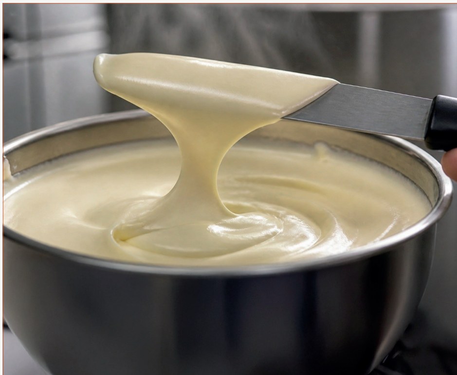
Figura 4 - Ponto do queijo fundido

Alternativamente, pode-se espalhar o produto sobre uma superfície lisa e verificar a capacidade de corte com uma faca, observando se a faca permanece limpa após o corte, ou pode-se tocar a massa já fria com o dedo. A fusão estará completa quando o dedo não se sujar ao toque.