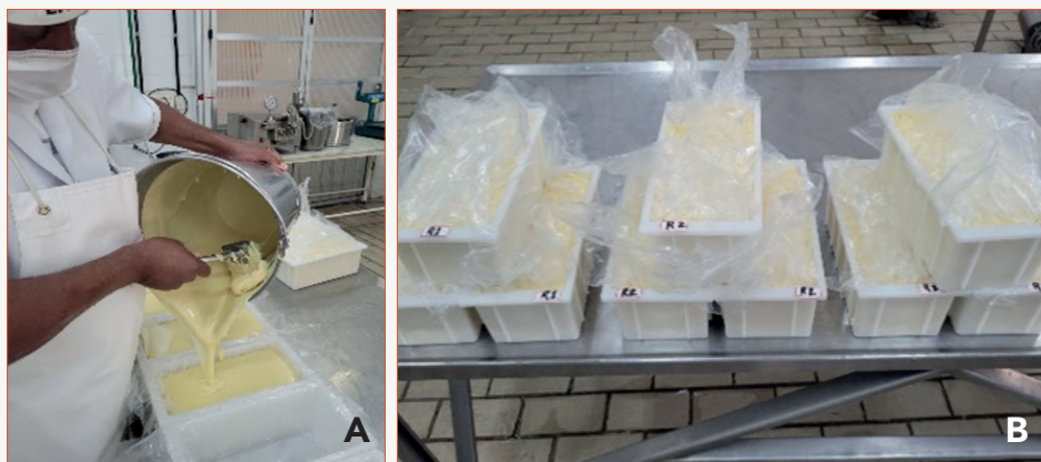
Figura 6 - Envase do queijo fundido

Nota: A - Enformagem do requeijão; B - Armazenamento sob refrigeração.