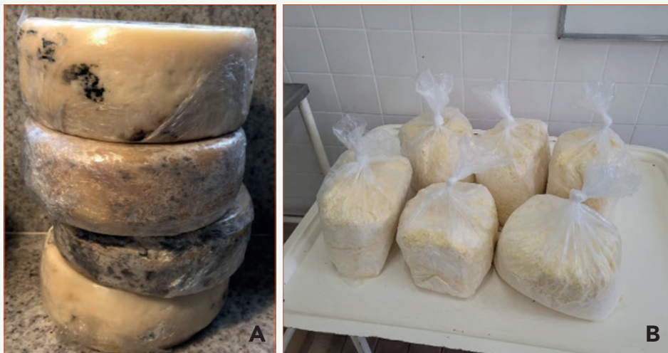
Figura 1 - Queijo antes e depois da etapa de limpeza

Nota: A - Queijos com defeitos antes da etapa de toilette; B - Queijos após a etapa de limpeza, trituração e pesagem.