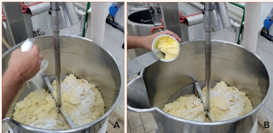
Figura 2 - Início do processo de fusão

Nota: A - Adição do sal fundente na massa de queijo; B - Adição de manteiga na massa de queijo.