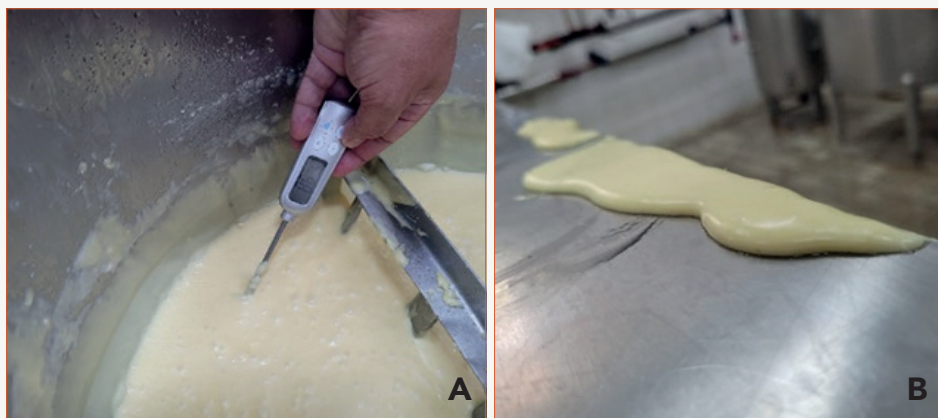
Figura 5 - Cozimento e ajuste do “ponto do requeijão”

Nota: A - Cozimento da massa; B - Observação do ponto da massa na mesa.