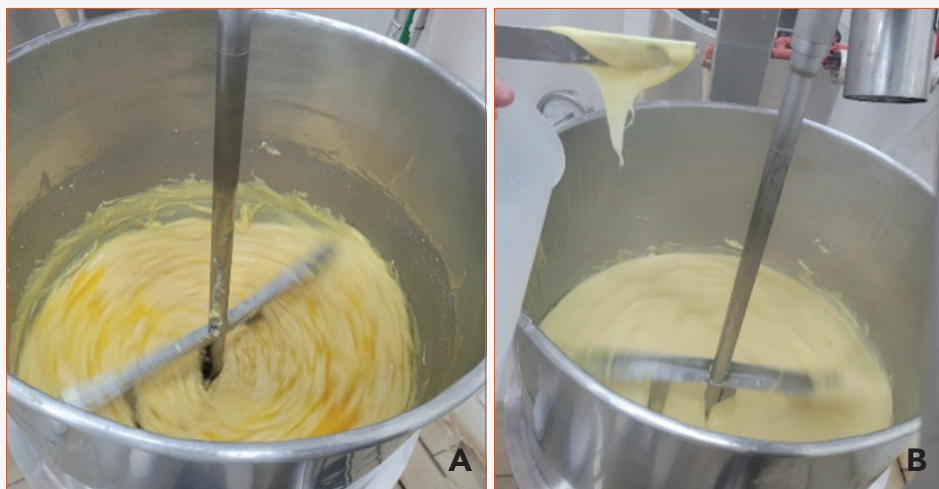
Figura 3 - Processo de fusão dos queijos em tacho aberto

Nota: A - Início do processo de fusão; B - Fusão completa dos queijos.