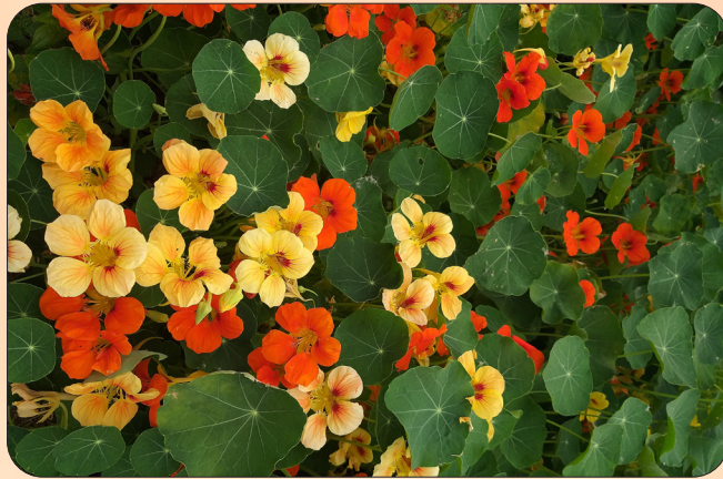
Tropaeolum majus L.

A capuchinha é uma Planta Alimentícia Não Convencional (PANC), conhecida por suas flores de cores vibrantes e sabor levemente picante, semelhante ao do agrião. Toda a parte aérea da planta pode ser consumida, incluindo folhas, flores, caules e frutos.