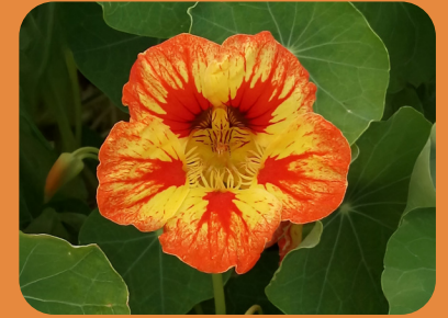
Flor de capuchinha