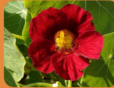
Flor de capuchinha