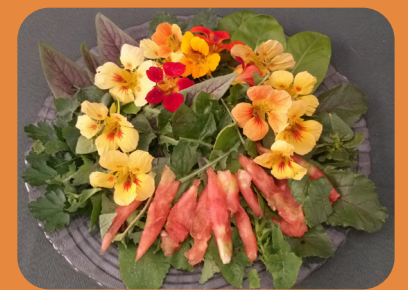
Salada de capuchinha