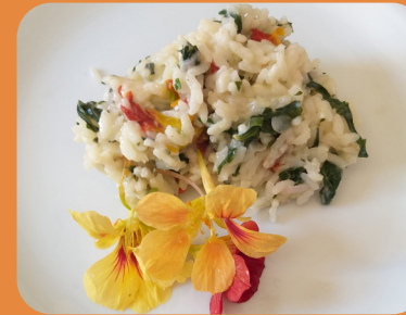
Risoto de capuchinha